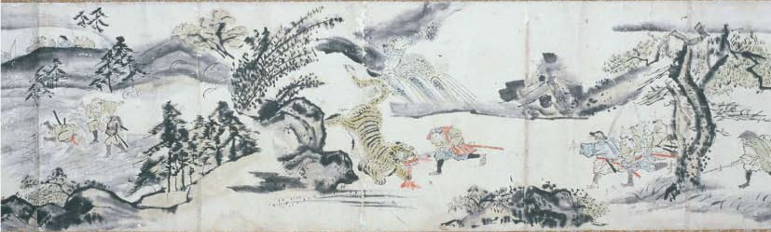
▲朝鮮出兵島津勢虎狩絵巻