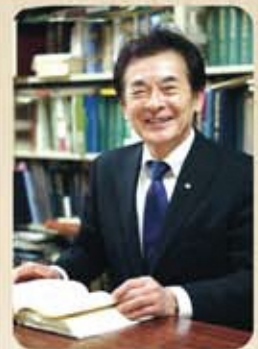
志学館大学教授 鹿児島県立図書館長 鹿児島大学名誉教授