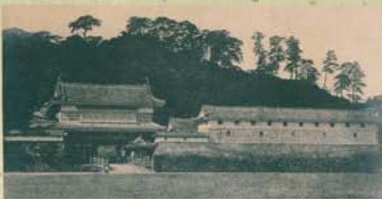
▲明治初年の鶴丸城

また、現在、鹿児島県において鶴丸城御楼門復元工事が進められており、その木工事を担当する岐阜県関市にある亀山建設㈱での材料加工の様子を紹介します。