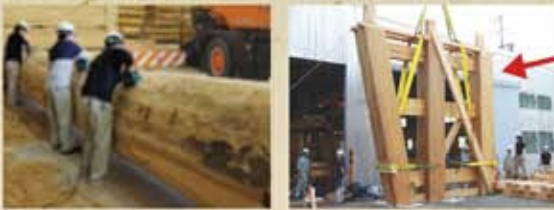
▲亀山建設での加工作業の様子