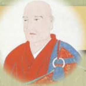
▲島津義弘公肖像