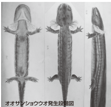
オオサンショウウオ発生段階図