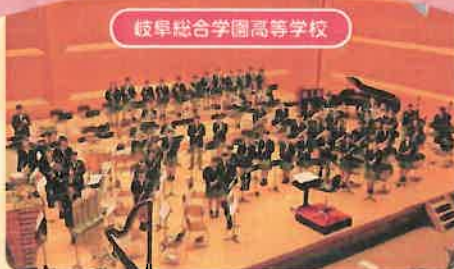
岐阜総合学園高等学校