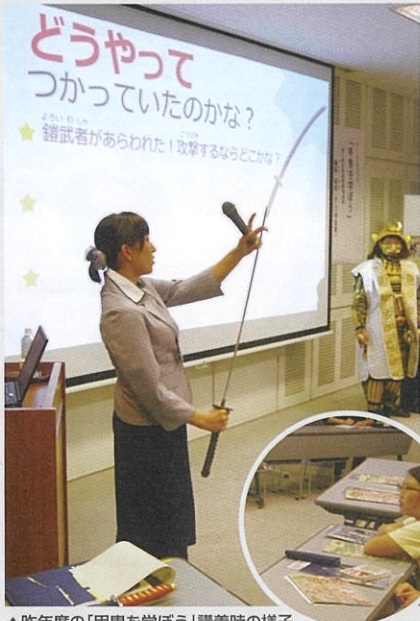
▲昨年度の「甲冑を学ぼう」講義時の様子