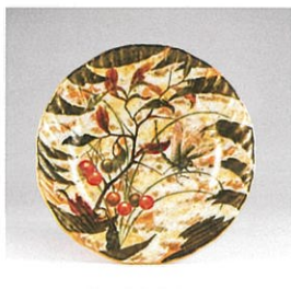
フランス エミール・ガレ 《木の実に蜻蛉図皿》1880年代後半