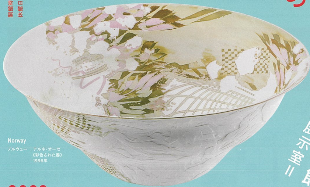
Norway ノルウェー アルネ・オーセ 《彩色された器》 1996年

開館時間：平日は午前10時～午後8時、土日祝日は午前10時～午後6時 休館日：月曜日（ただし7月18日は開館）、6月24日、7月19日、7月29日