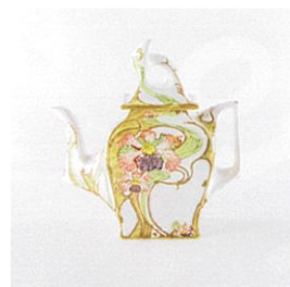
オランダ ローゼンブルフ 《ティーポット》1900年