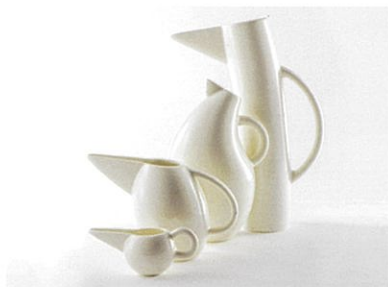
フィンランド アラビア 《ピッチャー「ストーリーボード」》1993年