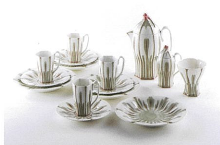
ドイツ マイセン 《クロッカス文テーブルセット》1896-1910年