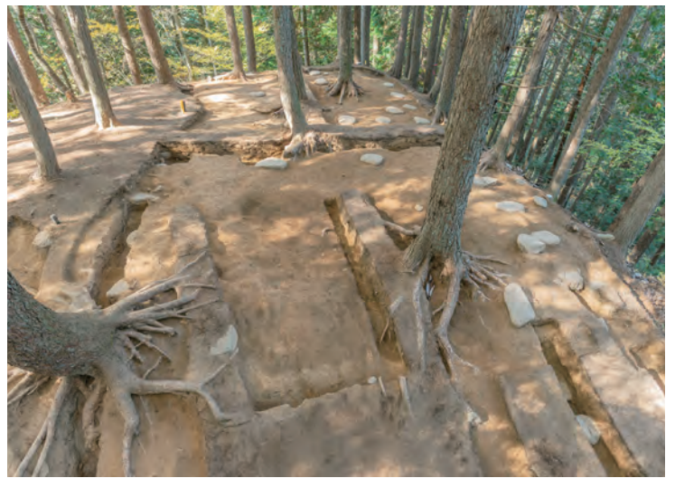
姉小路氏城館跡・古川城跡 見つかった礎石建物跡

その岐阜の城館跡について、特に国指定史跡を目指して、現在調査研究が進められている事例を中心に紹介します。また、城館が語る岐阜の戦国をふりかえります。