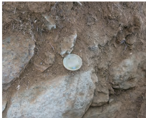
姉小路氏城館跡 瀬戸美濃焼出土状況