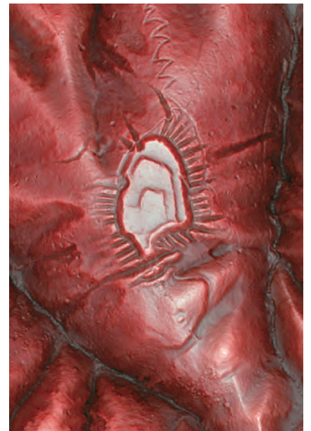
篠脇城跡 赤色立体地図 (郡上市教育委員会)