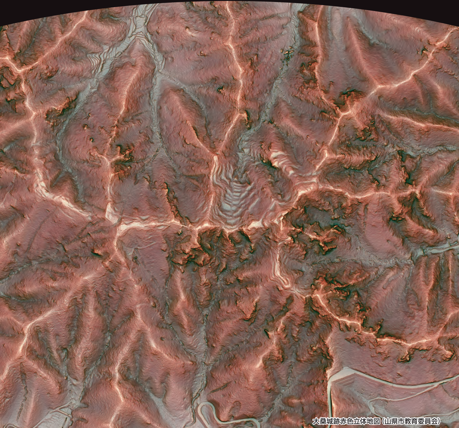
大桑城跡赤色立体地図 (山県市教育委員会)