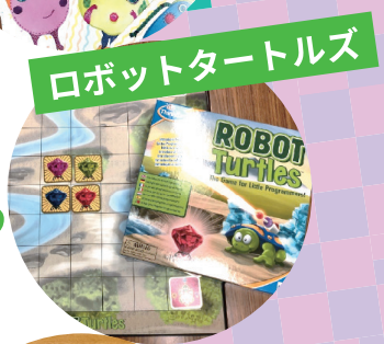
ロボットタートルズ