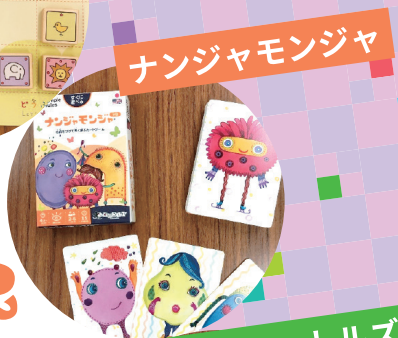
ナンジャモンジャ