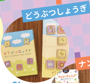
どうぶつしょうぎ