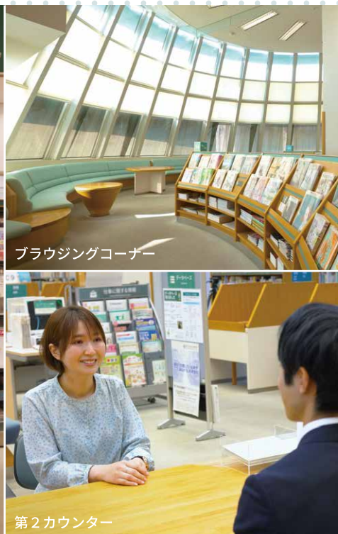
ブラウジングコーナー