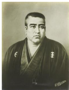
『近世名士写真 其1』より