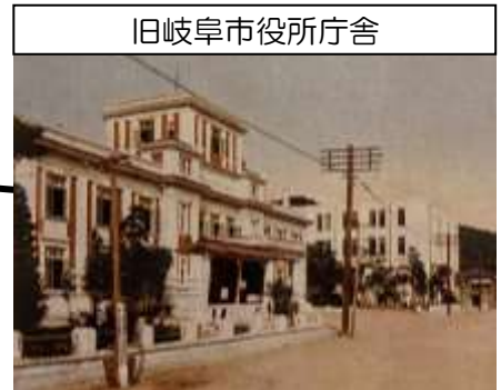
旧岐阜市役所庁舎